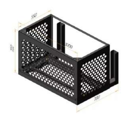
- Пример корзины для установки наружного блока кондиционера. Цвет Ral 7022

Лавка Композитный материал. Кубообразная рейка. Кирпич керамический лицевой "Риммер". Цвет бруно 20% Кирпич керамический лицевой "Риммер". Цвет красный 80%